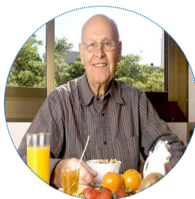
Améliorer son état nutritionnel