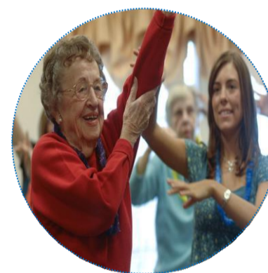
Bien bouger avec son âge