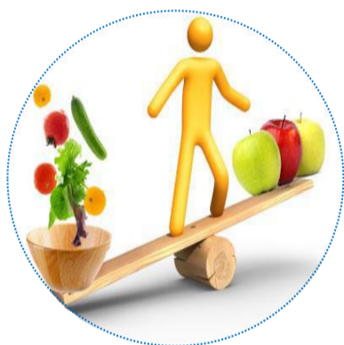
Comprendre son état nutritionnel