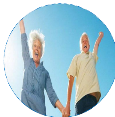
Bien vivre avec son âge